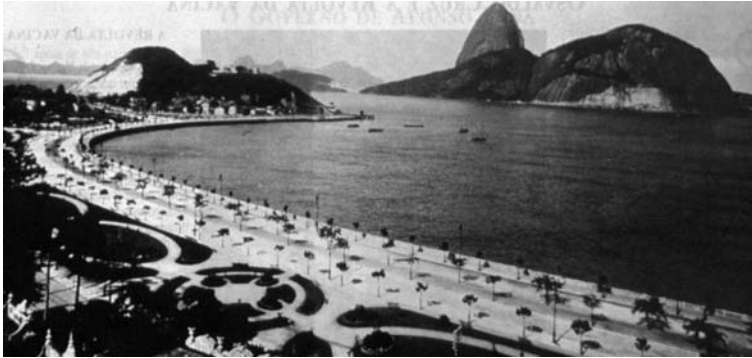
Rio de Janeiro no alvorecer do século 20.