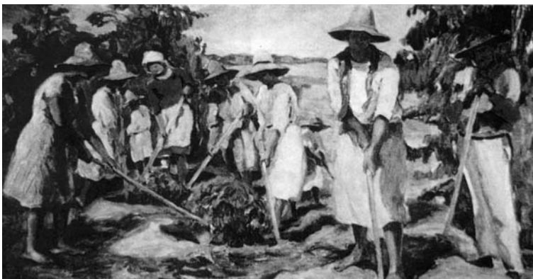
Imigrantes europeus após o fim da escravidão.