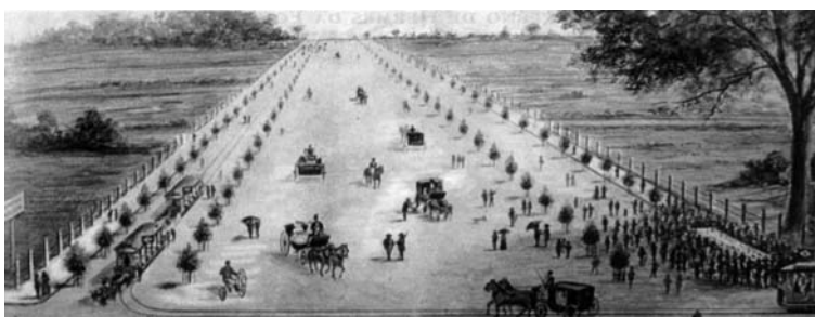
A Avenida do Café - São Paulo.