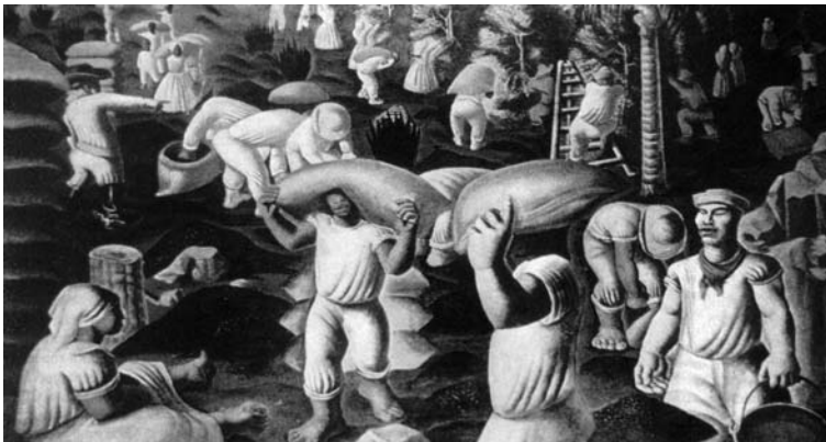
O café - Cândido Portinari.