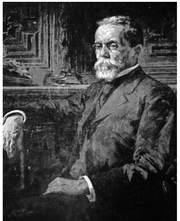
Machado de Assis.